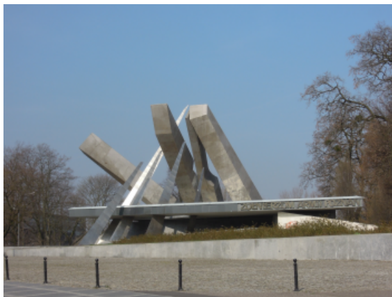
Powyżej: Pomnik Armii Poznań w miejscu budowy pierwszego kościoła luterńskiego.