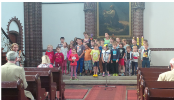
Powyżej: Tydzień Dobrej Nowiny w Szczecinie. Poniżej: Chór Gospel – Friends – Barnsdorf.