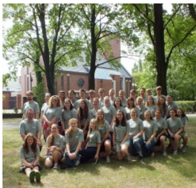
Powyżej: Obóz młodzieżowy „People4People”

wydawca: Parafia Ewangelicko-Augsburska w Poznaniu